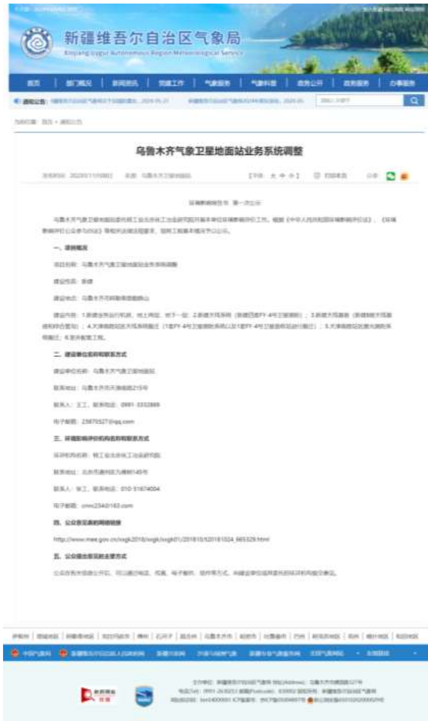
图1 首次信息网上公示截图

2023年11月8日在新疆维吾尔自治区气象局网站( http://xj.cma.gov.cn/xwzx/zxgg/ )公开了环境影响评价信息,公示截图见图1。