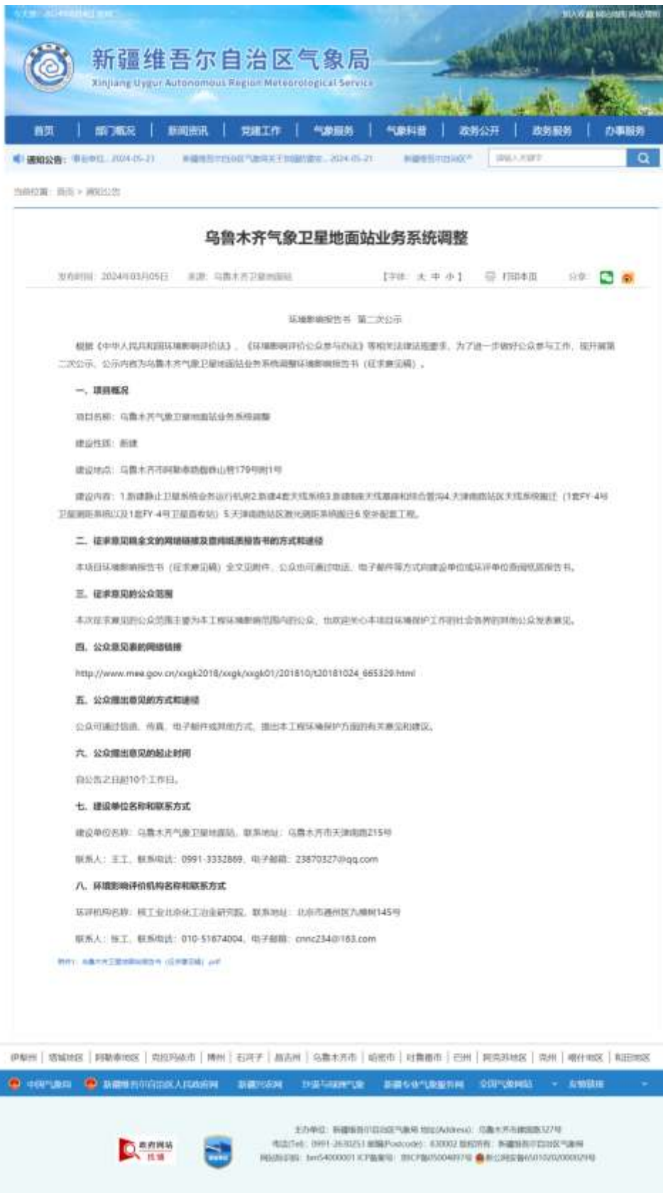
图 2 征求意见稿网上公示截图