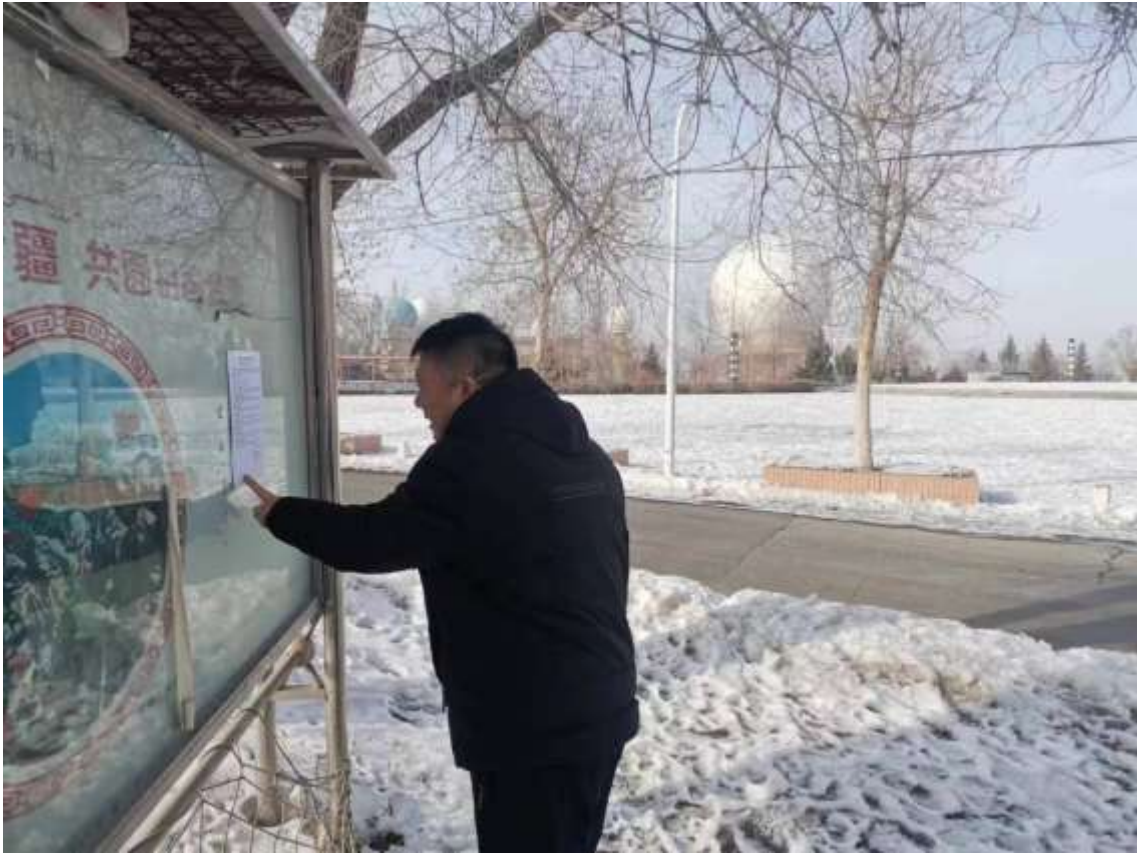
图 4 拟建天线处公告张贴