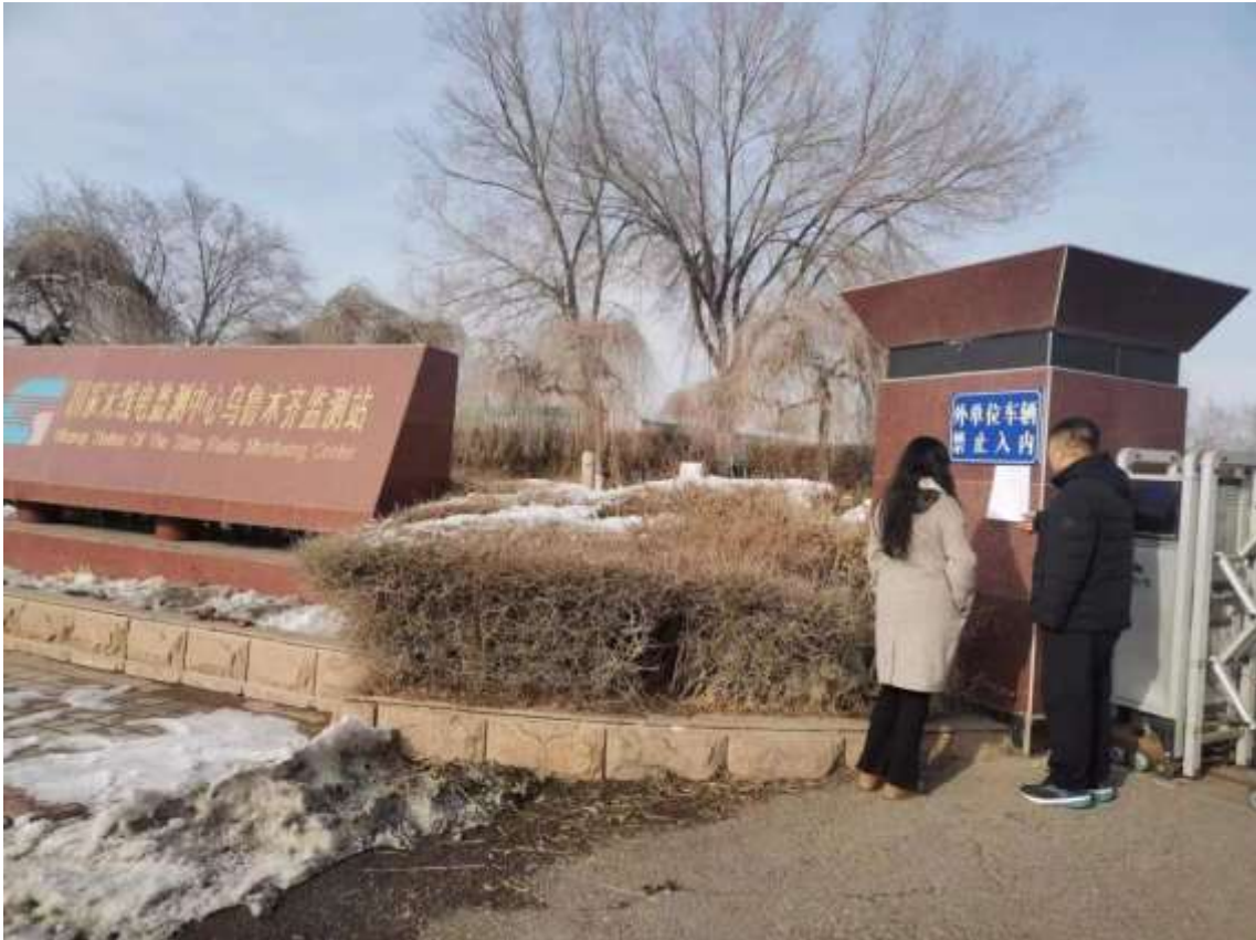
图 5 敏感目标处公告张贴